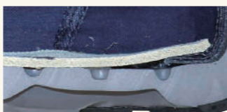
靴内張りに3mm厚 スポンジ使用+中敷き入り よりクッション性確保