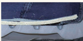
靴内張りに3mm厚 スポンジ使用+中敷き入り よりクッション性確保