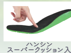
ハンシンスーパークッション入