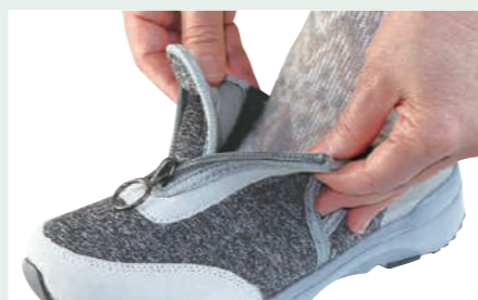
甲ファスナーとサイドゴム付で脱ぎ履き楽々

素材:アッパー/合成繊維 ソール/EVA+合成ゴム パッケージ:箱入り 重量(片足):180g(23.5cm)・220g(26.0cm) 仕様:22.5-24.0は幅広3E 24.5-28.0は幅広4E・低反発インソール