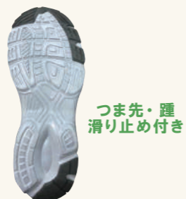
つま先・踵 滑り止め付き