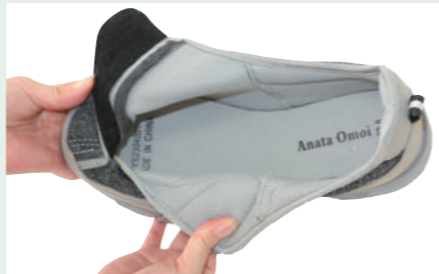
がばっと開いて脱ぎ履きしやすい

素材:アッパー/合成繊維 ソール/EVA+合成ゴム パッケージ:箱入り 重量(片足):170g(23.5cm) 仕様:幅広3E・低反発インソール