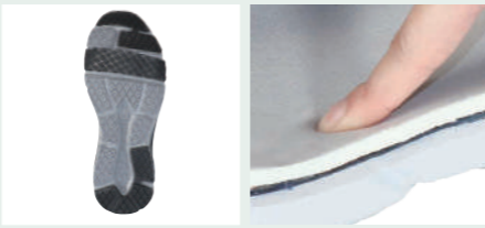
つま先・踵滑り止め付 低反発インソールが足の負担を軽減