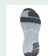
つま先・踵滑り止め付