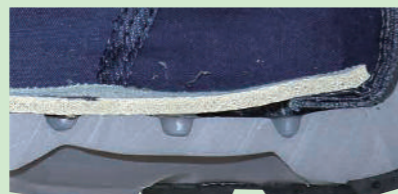
靴内張り3mmスポンジ