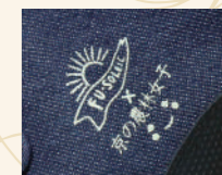
サイドマーク入り