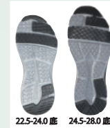
つま先・踵滑り止め付