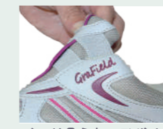
ゴムが見えないデザイン 楽で、カジュアルに履ける