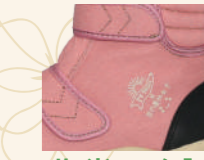
サイドマーク入り