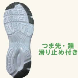
つま先・踵 滑り止め付き