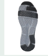
つま先・踵滑り止め付