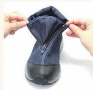
マチがしっかり 開いて履きやすく、 ごみが入りにくい