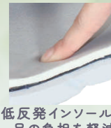
低反発インソールが足の負担を軽減