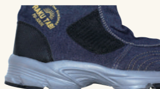
スニーカーソール仕様 クッション性抜群