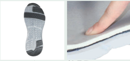
つま先・踵滑り止め付 低反発インソールが足の負担を軽減