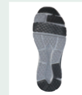
つま先・踵滑り止め付