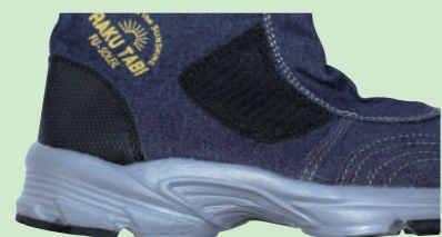
スニーカーソール