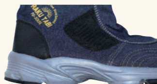
スニーカーソール仕様 クッション性抜群