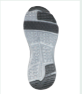
つま先・踵滑り止め付