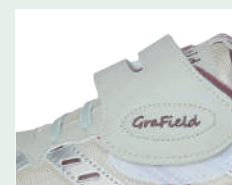
甲部マジックベルト+ ゴム紐仕様