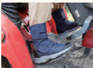
つま先・踵に滑り止めが 付いているので 農機具の運転にも使える