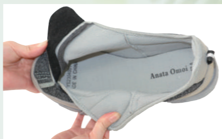
がばっと開いて脱ぎ履きしやすい

素材:アッパー/合成繊維 ソール/EVA+合成ゴム パッケージ:箱入り 重量(片足):220g(26.0cm) 仕様:幅広4E・低反発インソール