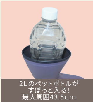
・レッド ・パープル ・カーキ